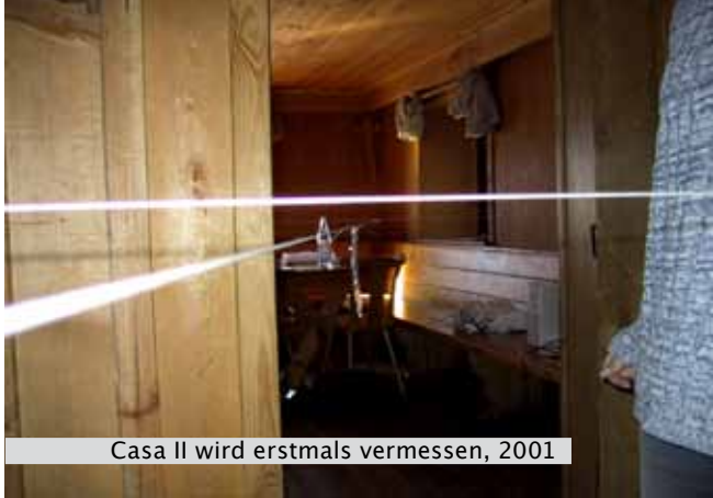
Casa II wird erstmals vermessen, 2001